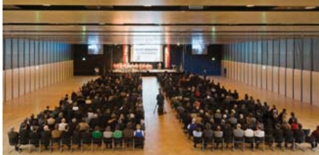
Die neue Messehalle

Messen CMW - Peter Lindpointner GmbH, Ahornweg 22, A-5311 Innerschwand/Mondsee Tel.: +43-(0)6232-65 63, Fax: +43-(0)6232-65 63-65, e-mail: office@cmw.at , www.cmw.at