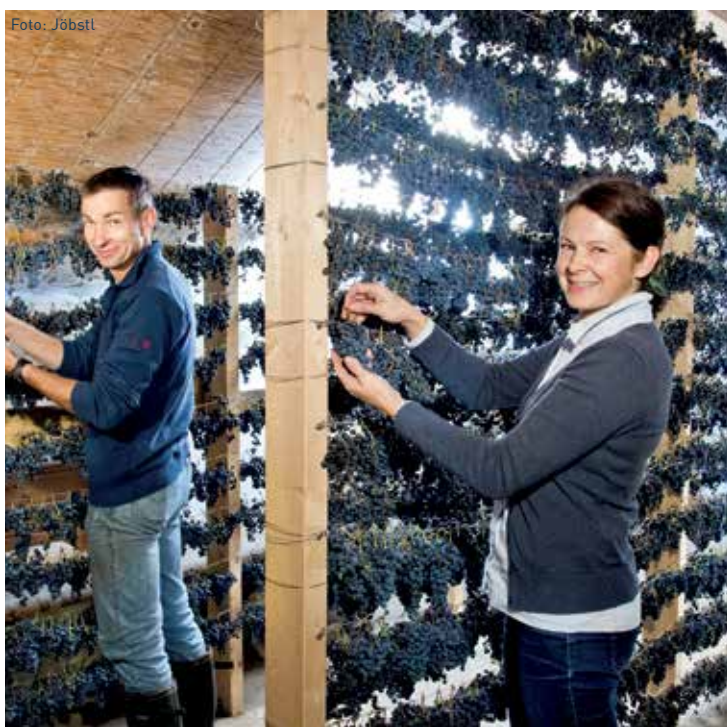
Eine sehr aufwändige Arbeit - der steirische Schilcher „Schnürlwein“, woraus später ein toller Dessertwein entsteht.

Neben vielen österreichischen Topwinzern sind auch in diesem Jahr wieder renommierte Winzer aus Italien, Deutschland und der Schweiz auf der Messe vertreten - dazu kommen Weinhändler mit Weinen aus Österreich, Italien, Frankreich, Iberien und Bulgarien.