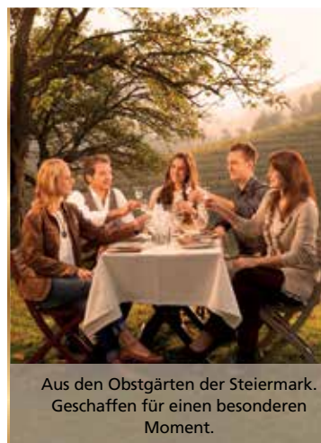
Aus den Obstgärten der Steiermark. Geschaffen für einen besonderen Moment.